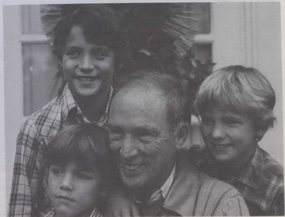
Une scène de famille pleine de fraîcheur illustre, cette année, la carte de vœux du premier ministre Trudeau que l'on voit entouré de ses trois fils Michel, Justin et Sacha.