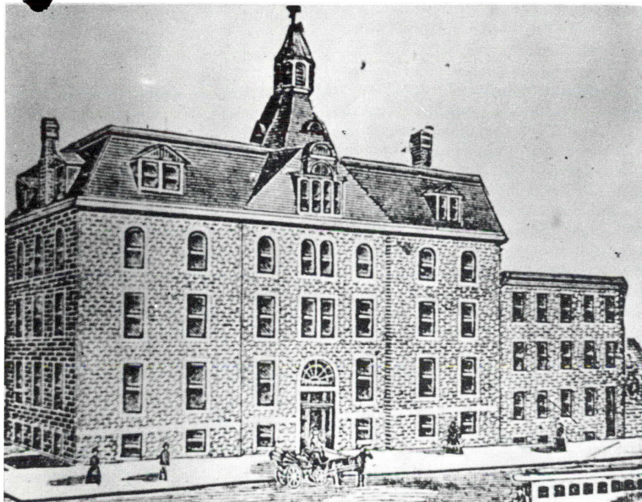
L'Académie de LaSalle, vers 1890.

Restaurée, l'historique Académie de LaSalle devient un nouveau centre de vie urbaine dans le vieux quartier de la Basse Ville d'Ottawa.