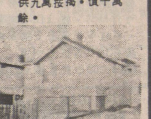
▲城多利及52。上三房。下二房。十一萬餘。