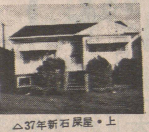
▲37年新石屋。上下完成。地 33x122。價十萬餘。