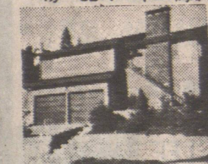
▲高尚住屋。好景實用。面積大。價十三萬餘