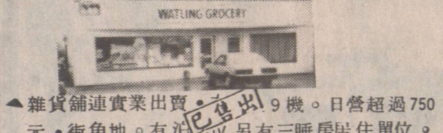
▲雜貨舖連實業出賣。9機。日營超過750元。街角地。有泊車位。另有三睡房居住單位。

本人經營一切買賣房屋。柏文。物業。生意。 免費估價。樂意服務。 ▲雜貨舖西區地點好。售 649。門前巴士站。每日平做七百五十元。價二萬九千。 ▲果仔濕。兼售鮮花。位於東區旺街。日營約五百餘。價二萬五千。