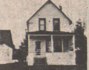
▲3868城多利街。交通方便近學校。九萬七。