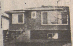
▲石米屋上三房。下二房。32街。十二萬餘