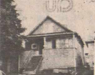
▲近福街上三房下二房。急售十一萬餘。