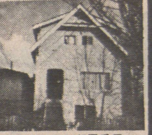
▲蓋士街三層兩房屋。月入息千二百。可按揭九萬按揭。價十萬餘。