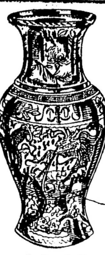
精工雕刻龍頭燈絲畫燈紗