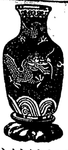
黃銅花盆 No 945 精工雕刻

景太藍花瓶 原價每條七十元現減沽每條卅五元 原價每條八十四元現減沽每條四十二元 原價每條九十九元現減沽每條四十五元 原價每條一百一十元現減沽每條五十五元 原價每條一百四十元現減沽每條六拾元 綉綉底面滿綉綉花無綉綉巾減價每條沽廿三元 搭巾有白地綉綉花有黑地綉綉花二種應尊意揀擇