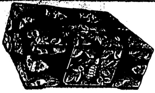
以上貨品在加境內包支寄費

大號長九寸闊六寸半高三寸半每只沽銀三元二毛 二號長七寸半闊五寸半高三寸每只沽銀二元八毛 三號長六寸半闊四寸半高三寸每只沽銀二元四毛 五洲藥房啓 Eng Chow Co. 104 Pender St. E. Vancouver, B. C.