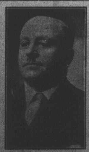
SERAPHIN LEGER Réélu député libéral du comté de Gloucester.