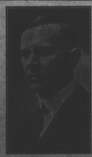
J. ANDRE DOUCET Réélu député libéral du comté de Gloucester.