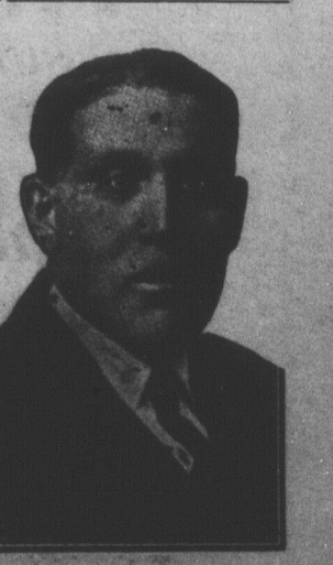
HENRY DIOTTE Réélu député conservateur du comté de Restigouche.

MADAWASKA actuel- Madawaska. de donner Madawaska, dans souvent sa- zar nstruite au sud- 25 JUN u Venetian Hall es sortes CHERIE raichissements. es soirs dans la S! ction aux s Chapeux s, les prome- rix très ré- 5.00 pour 00 3.50 pour 98 enfants à montant TRAS DSTON, N.-B. guay nt se présenter eurs paiements ria' hone te 25c 23c 10c 35c 41c 20c 25c 19c 25c 20c 25c D te