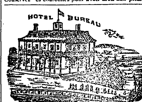
Table de première classe Bonnes chambres meublées et . . . . . . pension à des prix modérés.