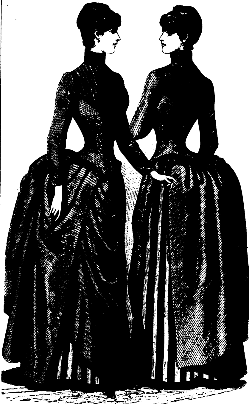
MODE.—TOILETTE EN SICILIENNE ET PELUCHE