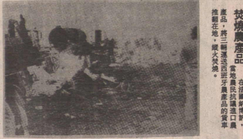
在法國納博納，當地農民抗議進口農產品，將三輛運送西班牙農產品的貨車推倒在地，縱火焚燒。

最近在西班牙的一些大城市，出現一股強烈的反吸毒品運動，抗議者要求政府採取更嚴厲的措施，打擊毒品。在馬德里，抗議者要求政府採取更嚴厲的措施，打擊毒品。在馬德里，抗議者要求政府採取更嚴厲的措施，打擊毒品。在馬德里，抗議者要求政府採取更嚴厲的措施，打擊毒品。