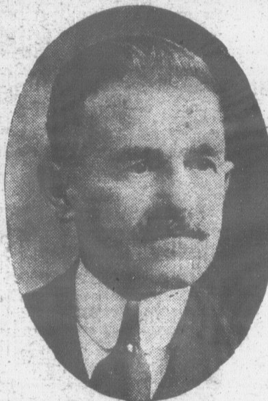
L'honorable J.-Ed. CARON, ministre de l'Agriculture de la province de Québec

Ministre de l'Agriculture de la province de Québec