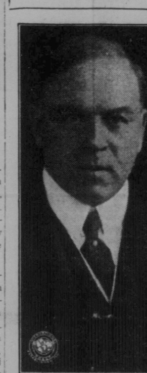
Hon. MacKenzie King.

Frisinnade åsikter och liberala tänkesätt behövas i ett ungt land, där det gäller att uppbygga en nation och en stat. En ekonomisk kris går över världen och i hårda tider behövs hårda män med kraftig vilja och klar blick för tidens krav.