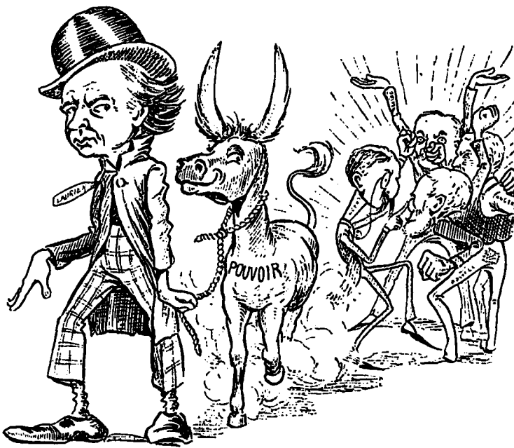
ILLUSTRATION D'UNE VIEILLE FABLE

Ce qui arrivera inévitablement à Ottawa.