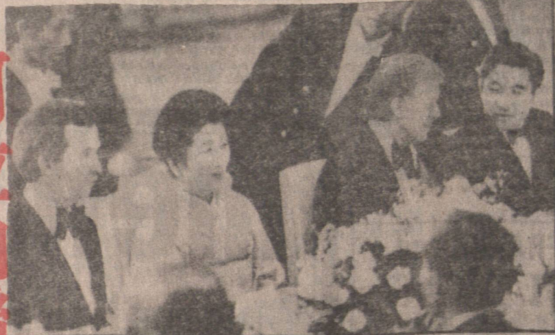
Prince Akihito of Japan at banquet in Tokyo.