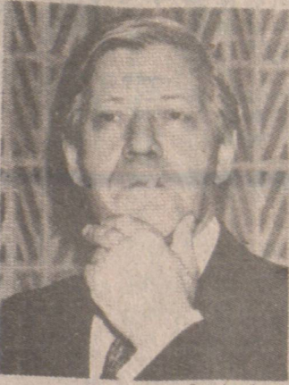
West Germany's Schmidt (德西)密史