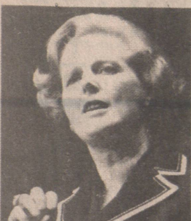
Britain's Thatcher (英)策薩