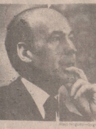
France's Giscard (法)當狄