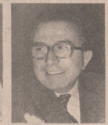
Italy's Andreotti (意)提奧地安