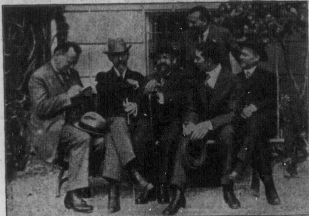
Група дипломатів С.Р.С.Р. що брали участь в конференції в Женеві.