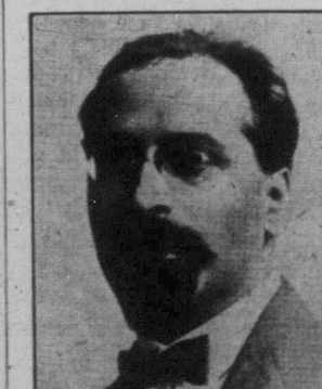
Л. М. КАРАХАН представник С.Р.С.Р. в Пекіні в Китаю.