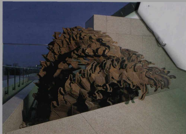
エスカレーターで4階上ると、トロントの彫刻家テッド・ビーラー氏の作品「砕ける波」が、出迎えてくれる。

OCT 1991 RETURN TO DEPARTMENTAL LIBRARY RETOURNER À LA BIBLIOTHÈQUE DU MINISTÈRE