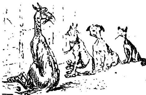
IV (Après les courses).—Eh ! ben ; parceque je n'ai pas été bien mené ! Est-ce ma faute ? Du reste, ça va vous permettre de gagner bien plus gros sur les courses de Bel-Air.