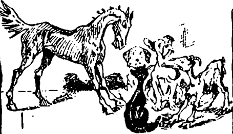
II Après les courses de Blue Bonnet.—Vous n'êtes pas assez naïfs pour croire que j'étais pour gagner la première bourse ! Vous ne me prenez pas pour un fou ?