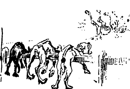
V Après les courses de Bel-Air.