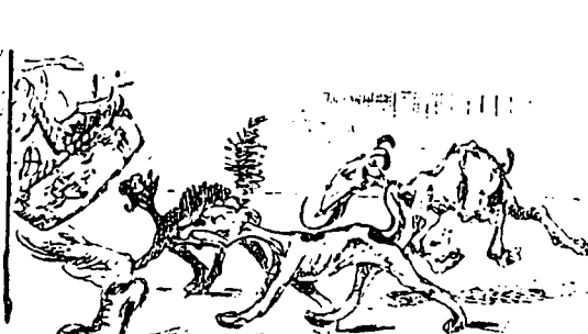
VI Mais ces amis fidèles ils le suivent plus que jamais, surtout de puis qu'il est devenu saucisse.