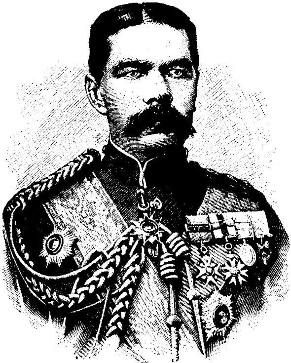
Le général lord Kitchener

Tarif spécial pour annonces à long terme