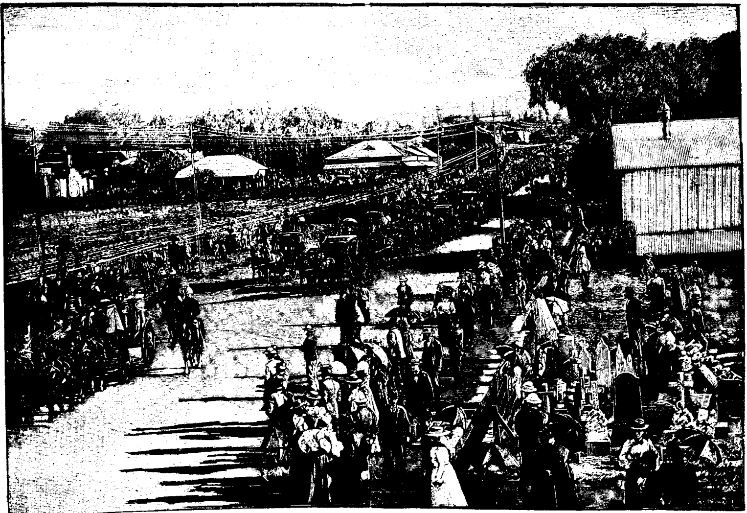
Voiture de gala du président Kruger

PRETORIA.—Le président Kruger et les personnages officiels conduisant à la gare le 1er commande beer