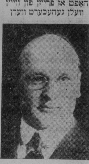
האָפט און פּרײַזן פון ווייץ וועלן געווענעכערט ערער

באשליסן און צו דערקלערן אינעמינעם סטרייק צום צווייטן יאָרצייט פון די 1929 ראיאָן אויף אונטערן 23טן — פראַטעסטירט קעגן לעגאָליזירן אלע אירן וואָס האָבן איינגעוואַנדערט אָן דערלויבנישן