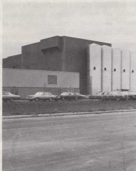
Nueva fábrica Sodispro en St. Hyacinthe.

La Sodispro convierte productos residuales de queso en concentrados proteínicos y lactosa mediante una tecnología concebida en Europa, pero refinada por la compañía hasta conseguir un sistema más eficiente y rápido que utiliza menos energía y ocupa menos espacio. La compañía tiene todavía acuerdos de intercambio tecnológico con empresas europeas. La nueva fábrica incluirá también un centro de desarrollo, investigación y con-