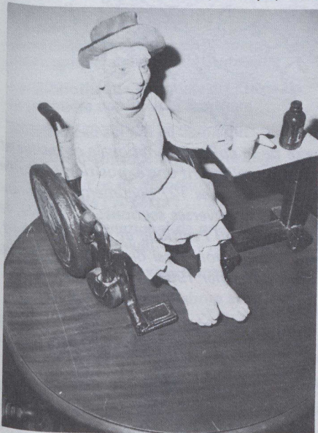
Le vétéran, 1974.

Détenteur d'un baccalauréat en beaux-arts de l'Université du Manitoba, il a