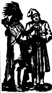
MARQUE DE COMMERCE.

Voulez-vous ne plus tousser? Faites usage de l'Elixir Resineux Pectoral, le grand remède du jour contre la TOUX, le RHUME et autres affections de la Gorge et des Pouxmons. De nombreux certificats émanant de citoyens éminents, de membres du clergé, de communautés religieuses, de médecins distingués attestent l'efficacité merveilleuse de cette préparation. A défaut d'espace nous ne donnons que le certificat suivant: