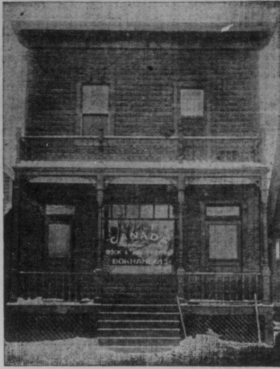
CANADAS TRYCKERI OCH KONTOR, 259 FOUNTAIN STREET.

cket större areal plogbar mark 000,000 bushels. Särskligen skall tagas i anspråk för hvetet i detta resultat hafva uppnåtts, in-Canada än i Staterna. I en icke ännu innevägnare antalet uppgifvadt för afsläpna framtid kunna gått till 30,000,000 människor, vid 000,000 acres brukas för hveteproduktion vidpunkt Canadas export lian, hvilket skulle betyda en produktion af 800,000,000, ja 1,200,000,000 ma proportioner.