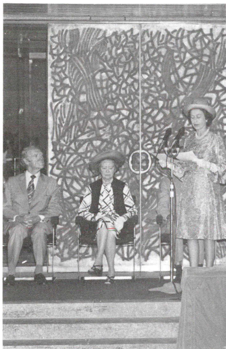
La reine Elizabeth prononçant l'allocution en hommage à feu Lester-B. Pearson lors de l'inauguration du nouvel édifice du ministère des Affaires extérieures qui portera le nom de l'ancien premier ministre. Mme Pearson et le secrétaire d'État aux Affaires extérieures, M. Mitchell Sharp, accompagnent la reine.

“Des portes de bronze richement sculptées ouvrent sur le hall d'entrée haut de deux étages, qui n'est pas sans analogie avec le foyer d'un grand hôtel et qui sert, en quelque sorte, de place publique au centre des différents édifi-