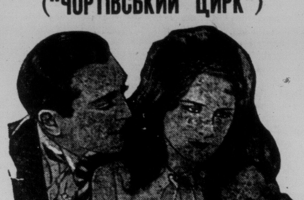
NORMA SHEARER & THE DEVIL'S CIRCUS

В цій фільмі побачите цілий цирк після європейського стилю. Головну ролу в штучі має славна кіно-фільмова акторка НОРМА ШІПЕР. Крім неї виступають Чарлс Еммет Мек, Кармел Меерс та інші.