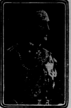
PRINCE ARTHUR OF CONNAUGHT

I närvaro af en stor samling kungliga personer förmälas i onsdags prins Arthur af Connaught med sin kusin hertiginna af Fife. Vigneln förrättades i St. James Palace i London, och bland de närvarande märktes: