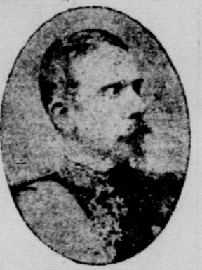
General Axel Rappe.

75 år fylle den 2 oktober generalen frih. Axel Rappe. Den i de vidaste kretsar kände officeren har bakom sig en mera än halfseklings statstjänst, däraf 23 års dels som generalstabschef, dels som krigsminister. Vid 21 års ålder blef han underlöjtnant vid Uplands regemente, hvar chef faders då var Axel därpå afledde han i Upsala kantskolan. Efter att ha genomgått Mariobergskursen inträdde han 1865 i generalstaben, där han 1872 blef kapten, året därpå major, och sedan efter tre års tjänstgöring vid Bohusläns regemente öfverste och t. f. chef. 1885 blef han generalmajor och chef för generalstaben.