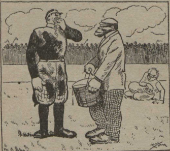
Le même universitaire, à la joute de football, suçant une éponge qui a déjà passé par la bouche de tous les autres joueurs.