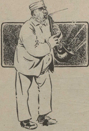
Quand signor Doremi a fini son solo de saxophone