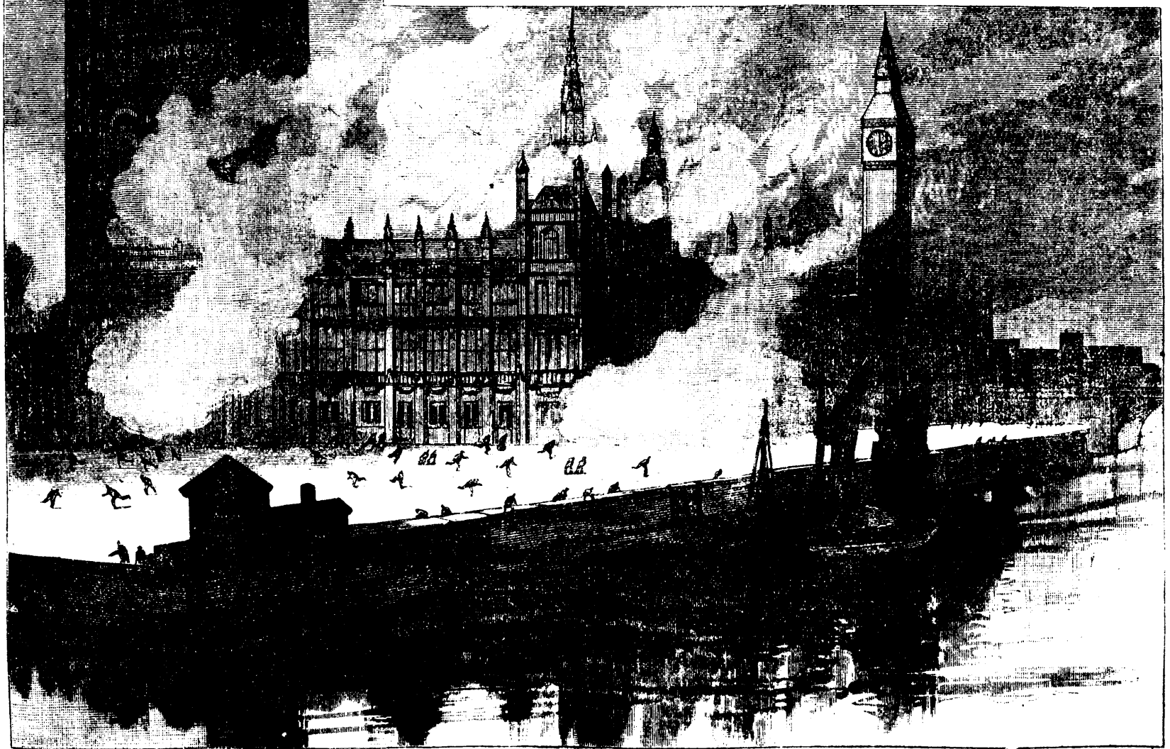
LA DYNAMITE EN ANGLETERRE. — La Chambre des Communes où ont eu lieu les dernières explosions.