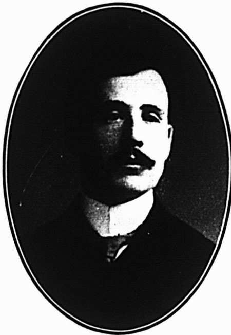
M. J. Adélarde Lamontagne

Contreforts en cuir solide, en carton- cuir, en Fibre en Union. Semelles d'in- térieur tout cuir et combinaison. Spécia- lité de sous-caps en cuir. Marchands de débris de cuir.