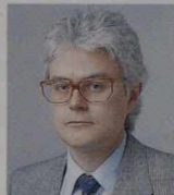
ブライアン・ ハンブルトン Brian Hambleton (参事官) 国際経済、2 国 間経済・貿易協議、経 済・金融統轄