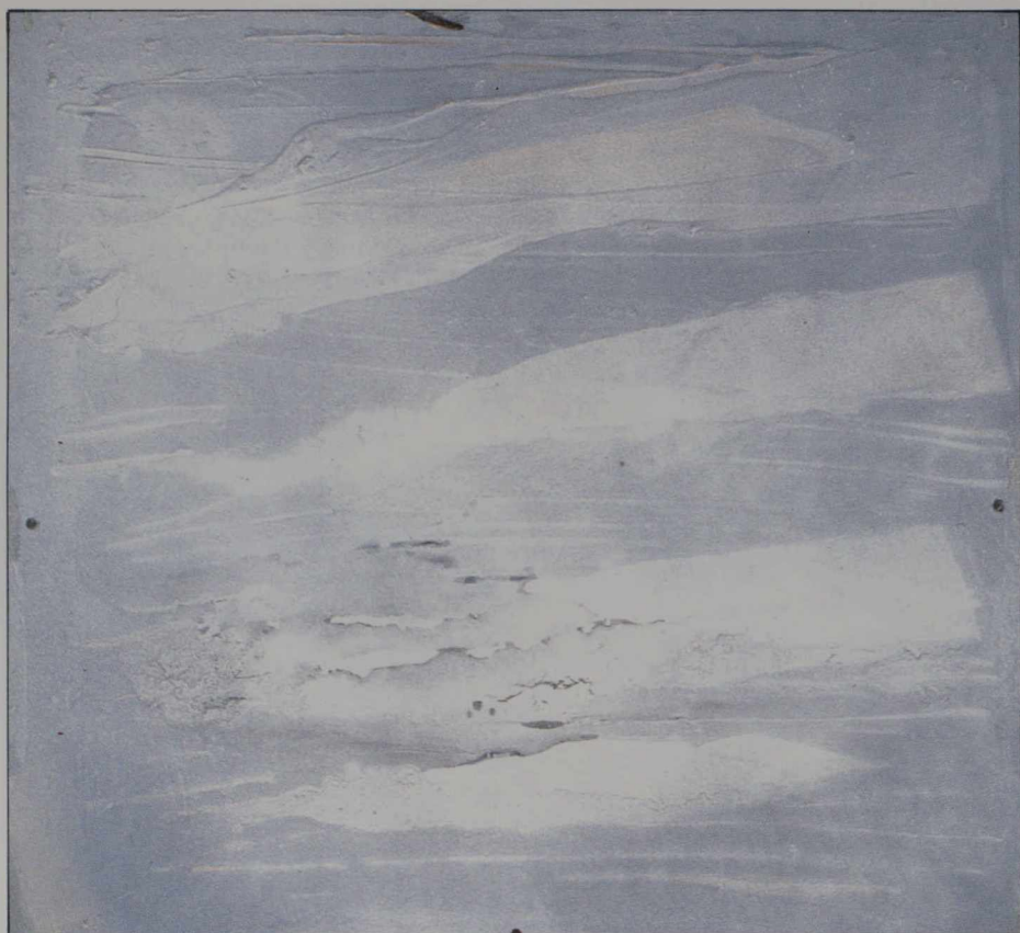
Otto Rogers, Turning Cloud .