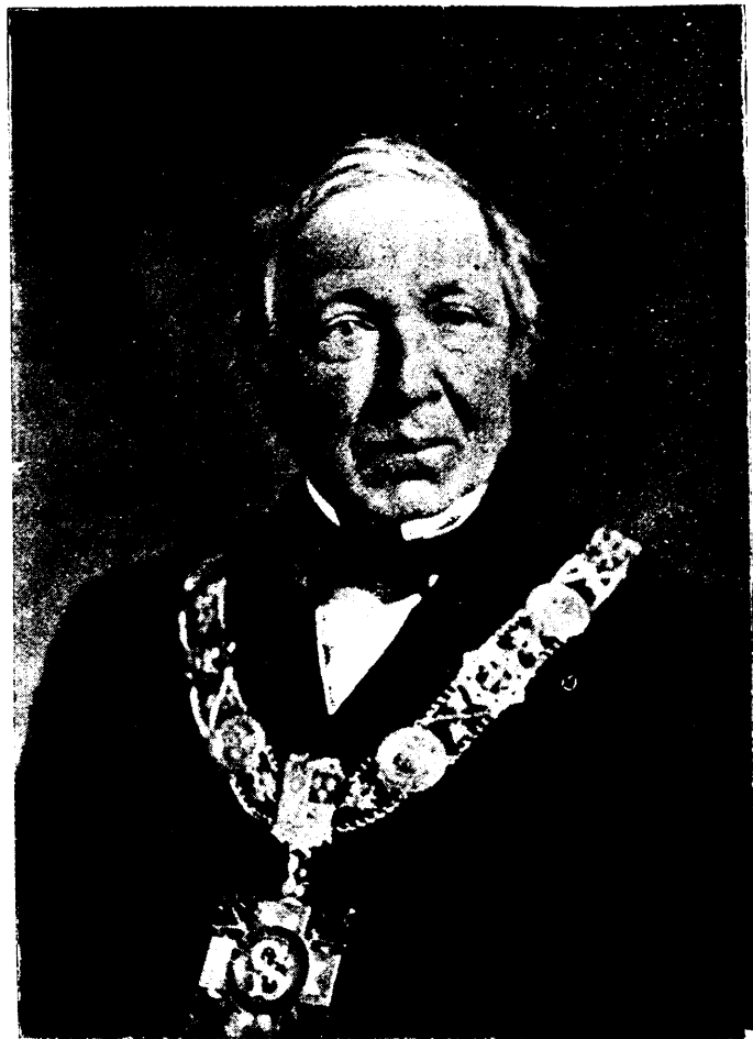
L'HON. CHARLES-SÉRAPHIN RODIER, DÉCÉDÉ