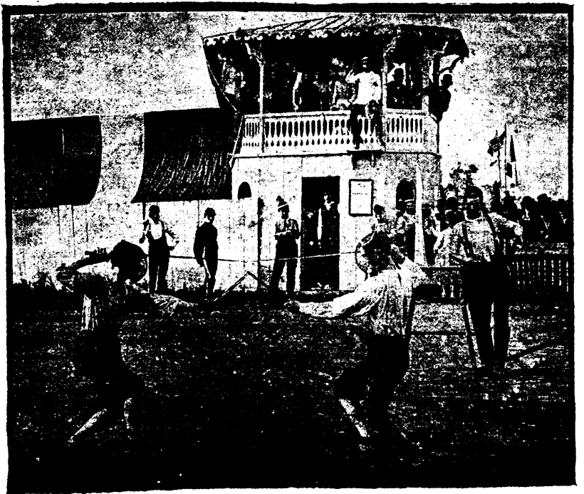
COMBAT A LA DAGUE ET A L'ÉPÉE

TOURNOI D'ARMES DU MOYEN-ÂGE PAR LES GARDES DU PALAIS ARCHIEPISCOPAL DE MONTREAL, Photographies et gravures par Armstrong