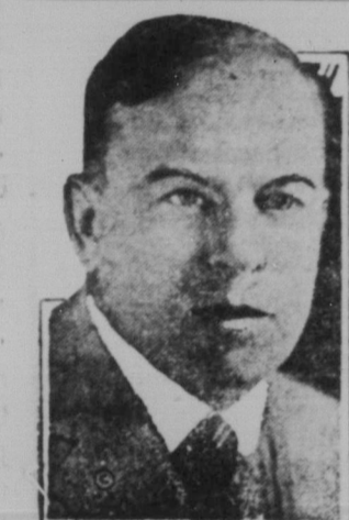
Hon. W. MacKenzie King.

Albertas nya likörslag är ännu föremål för livliga debatter. Frågan angående s. k. "permits" är nu avgjord.