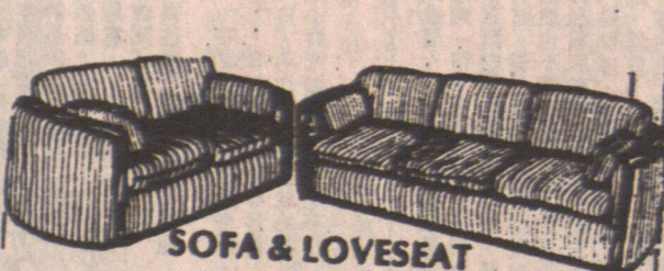
SOFA & LOVESEAT 兩件頭梳化 大方耐用 特價 $599.00

營業時間: 星期一至五上午十時至晚九時 星期六上午十時至下午六時 星期日及假期上午十時至下午六時