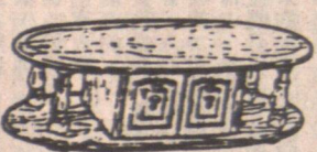
圓形 CAFE TABLE 最適合送禮用 $159.00