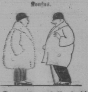
„Tannerwetter, was für ein fe- ner Pelz! Welchen Sie gehört dena das Fell?“

Bei Bestellungen und bei Einkäu- fen erwähne man den „Courier“.