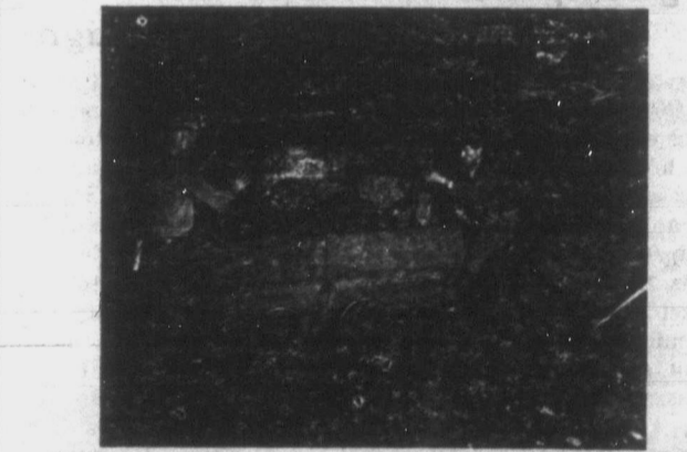
"Ladolnak" azaz felrakodnak a magyar bányászok a drumhelleri bányák egyik kőszénfejtő tárnájában. Amint képünkön is látható, a legkisebb beomlás is könnyen veszélyeztetheti honfitársaink egészségét, sőt életét is a megélhetésért a föld mélyén folytatott küzdelemben.