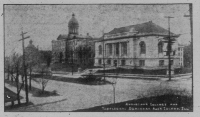
Augustana College i Rock Island, Ill. Bilden härövan visar Augustana College och teologiska seminarium i Rock Island, Ill., där Augustana synoden nyligen höll sitt stora årsmöte.