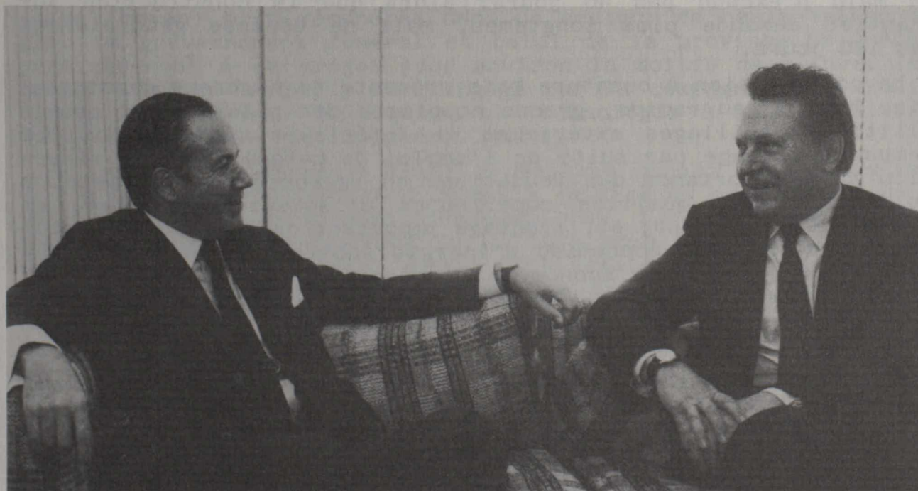
EC President Gaston Thorn and Canada's Deputy Prime Minister and Secretary of State for External Affairs, Alan MacEachen, confer in the margins of the United Nations General Assembly in New York (CANPRESS)