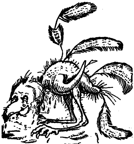
LE VIEUX COQ BLEU.