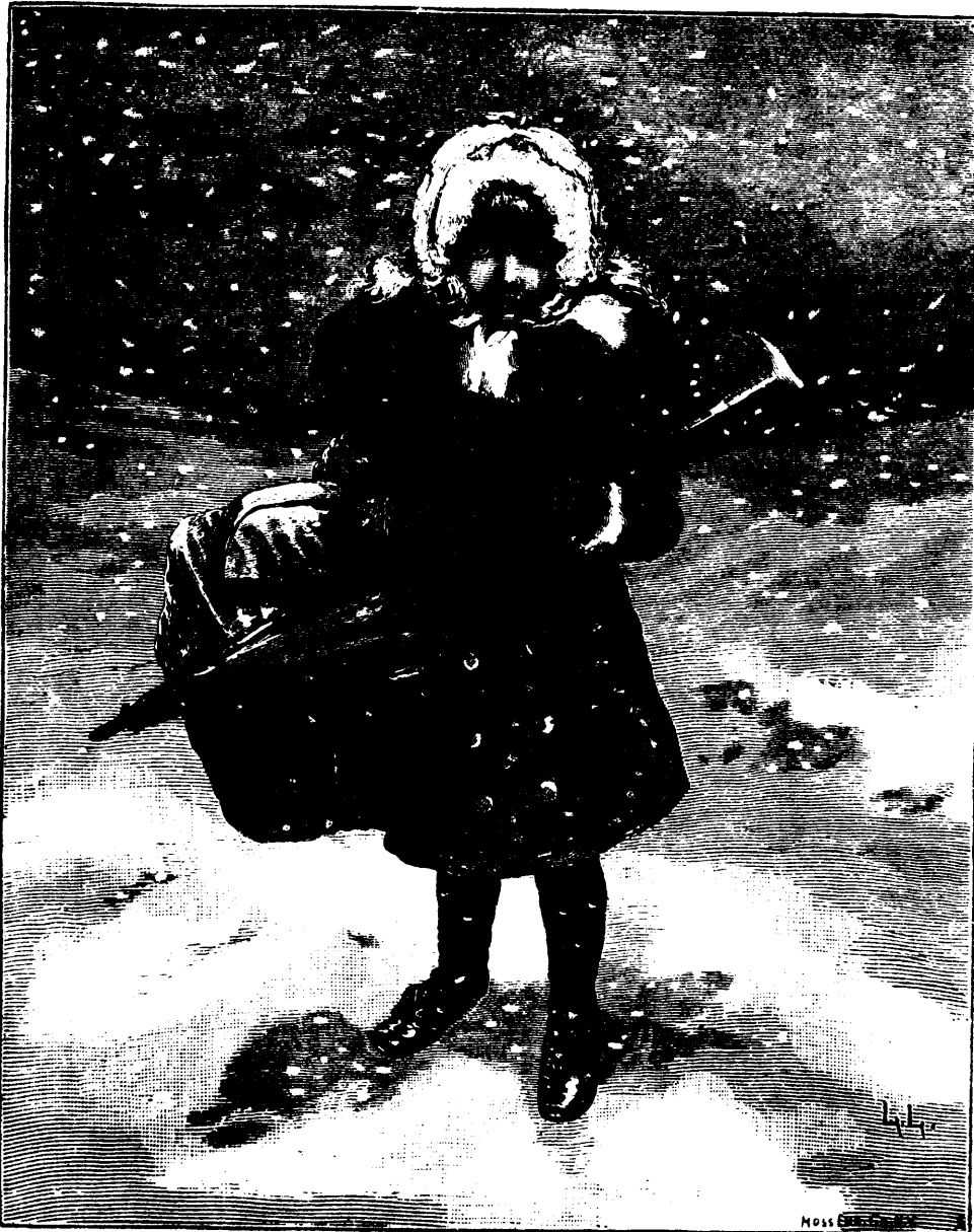
LA PETITE COMMISSIONNAIRE