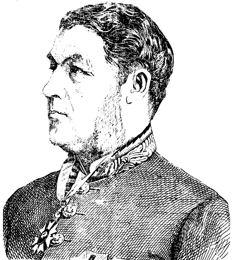
SIR CHARLES TUPPER BARONET ET SECRÉTAIRE D'ÉTAT DU CANADA