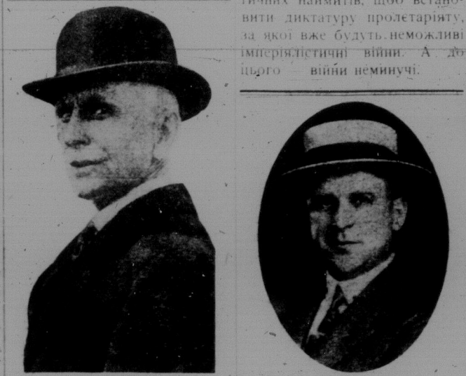
СУДДЯ ТЕЕР, який засудив невинних Сакка й Ванзети на смерть і не допустив нової розправи. МІЛІОНЕР ФУЛЕР, губернатор штату Масечузетс, що переводив тайне слідство над Сакком й Ванзети й потвердив вирок Теєра.

Сьогодні, напередодні 15-х роковин початку світової війни, ми, клясого свідомі пролетарі, розуміємо, що стоїмо напередодні нової імперіалістичної різанини. Ми стоїмо напередодні організованого