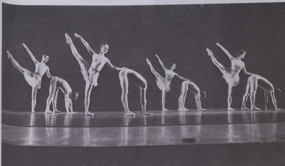
Excursions , chorégraphie de Lawrence Gradus.

La première européenne d' Excursions aura lieu au mois d'octobre et celle d' Hommage durant l'hiver de 1983.