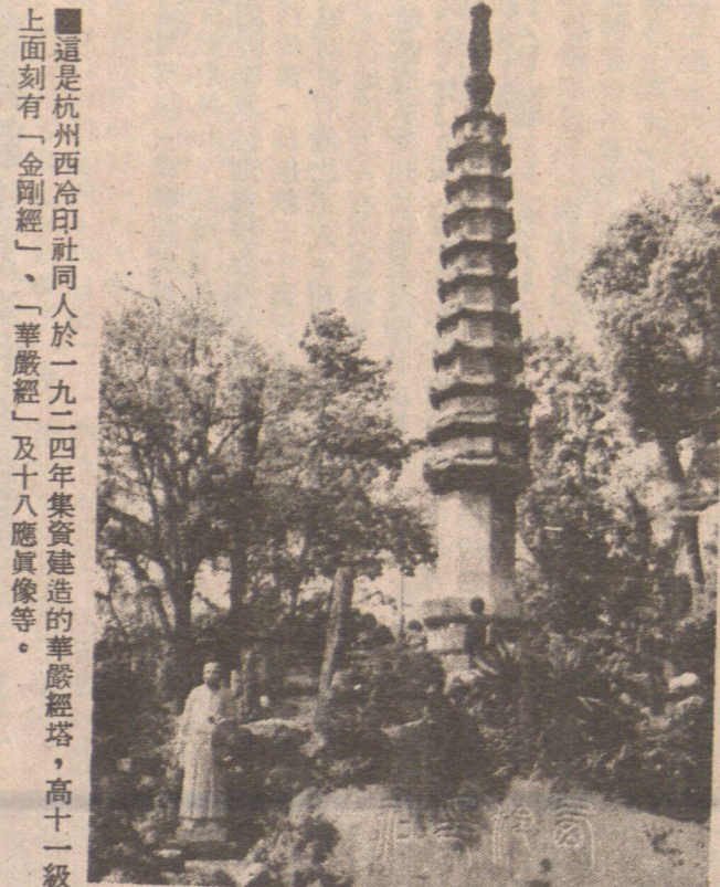
這是杭州西湖印社同人於一九二四年集資建造的華嚴經塔，高十一級，上面刻有「金剛經」、「華嚴經」及十八應真像等。

香港太空館職員於本週二，利用該館的太陽望遠鏡，拍攝到太陽表面出現黑子羣。 據悉，這次拍攝到的黑子羣，位於太陽的赤道附近。該黑子羣由多個黑子組成，其中最大的黑子，直徑約為一千公里。 香港太空館職員表示，這次拍攝到的黑子羣，是該館自成立以來，拍攝到的最大的黑子羣之一。該黑子羣的出現，預示着太陽活動將進入一個活躍期。