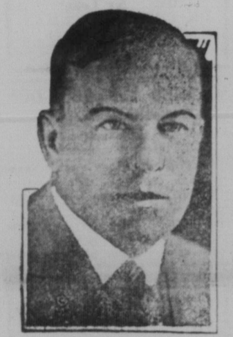
Rt. Hon. W. Mackenzie King.

Fredagen den 2 oktober anländer Canadas premiärminister till Winnipeg. Han kommer att tala i lördagen den 4 oktober under den Unge liberals klubbens auspici. Hans fulla program är ännu ej bekant, men de som önska göra sig familjära därmed rådas att konsultera dagspressen vid slutet av veckan.