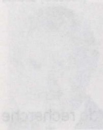
Lyle Vanciel Libéral — Prince-Édouard

Deuxième session de la trente-quatrième législature, 1989-1990-1991