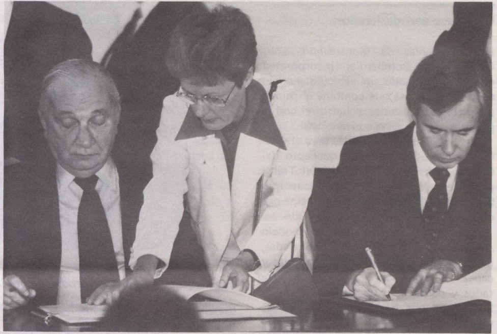
Los Ministros de Relaciones Exteriores del Brasil, Ramiro Saraiva Guerreiro (izquierda) y del Canadá, Mark MacGuigan, firman un tratado.

tante de la Companhia de Pesquisas Minerais en la adquisición de equipos tales como plataformas de perforación, accesorios y equipos de ensayos y prospección; un financiamiento de US$ 30 millones como garantía de la venta — por parte de varias firmas canadienses a la empresa estadual Petróleo Brasileiro S.A. (PETROBRAS) — de bienes y servicios destinados principalmente al sector petrolífero, pero también aplicables a los sectores de la explotación de gas, minería