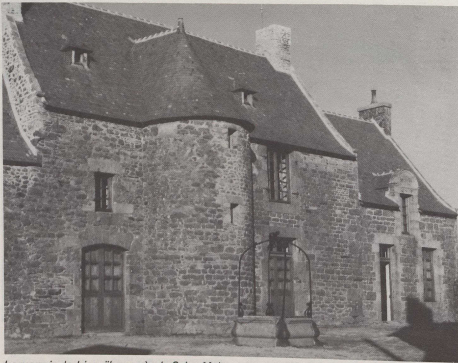
Le manoir de Limoëlou, près de Saint-Malo.