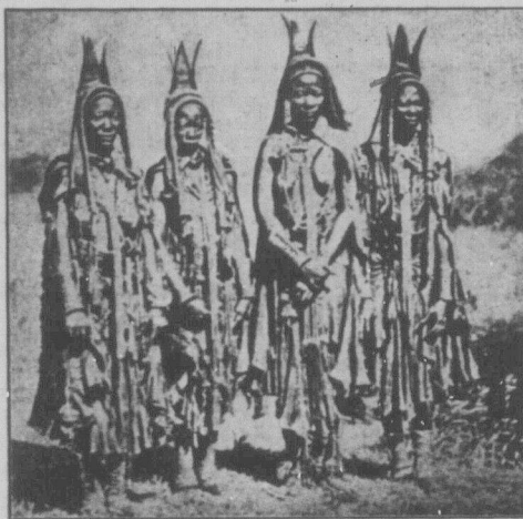
Жінки південно-африканського племені Гереро.

Але тепер, після півстолітнього миру, ця родюча країна починає знову відроджуватись. Цьому сприяє також велика