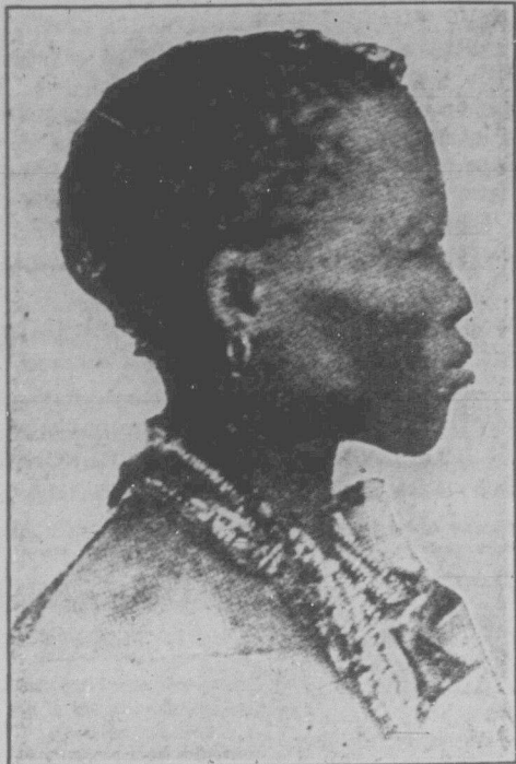
Бумшен, африканське племін.

Але хоч рабство в Нігерії офіційно заборонене, хоч зовнішню країну й стає культурнішою, то експлуатація населення "доброчинцями" Англійцями процвітає. Великі податки, низька оплата праці чоловіків, а особливо жінок та дітей, голод — цілком знесилюють тубільне населення. Не зважаючи на довгий робочий день, робітникам ледви вистачає заробітку на напівголове існування. Такий уже загальний характер правління імперіалістів у своїх колоніях.