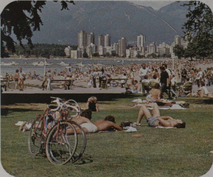
Gente en la playa Kitsilano de Vancouver.

La Colombia Británica es la provincia más occidental de Canadá, rica en recursos naturales de los que dependen las principales industrias de la provincia: silvicultura, minería, pesca y manufacturas. La industria pesquera, por ejemplo, con un volumen comercial de unos 200 millones de dólares anuales, es bien conocida por su captura anual del fecundo salmón del Pacífico. Las tierras se caracterizan por su cultivo floreciente de frutas de todas clases, sus granjas lecheras en las regiones meridionales y la cría de ganado vacuno en el norte y hacia el interior, donde se encuentran algunos de los ranchos más grandes de Canadá.