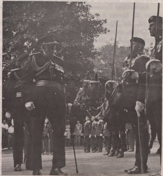
Le major général Vanier, alors gouverneur général du Canada, passe en revue le 8th Canadian Hussars à Rideau Hall en juin 1966.

Durant la Première Guerre mondiale, le 8th Hussars a fourni un escadron au 6th Canadian Mounted Rifles et a renforcé plusieurs autres unités. Durant la Deuxième Guerre mondiale, les Hussars ont quitté le sol canadien et ont servi, comme unité